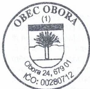
Obec Obora Josef Alexa